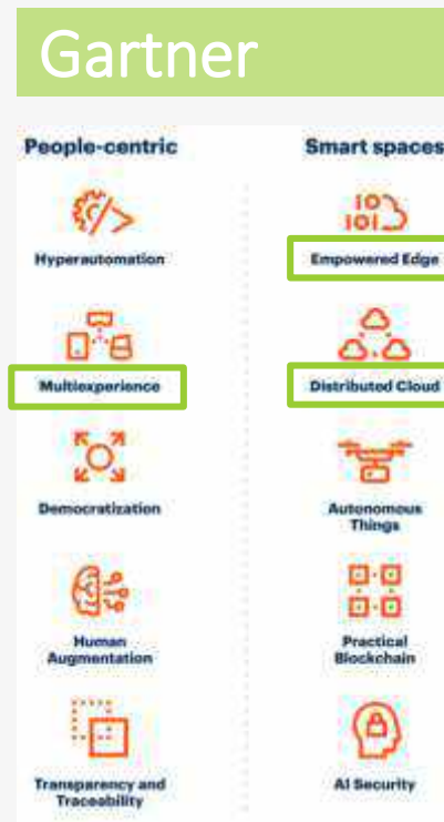
Gartner Top 10 Strategic Technology Trends for 2020